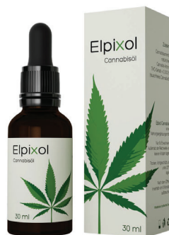
Elpixol Cannabisöl Tropfen 30 ml PZN: 16612544 UVP: 39,99 €