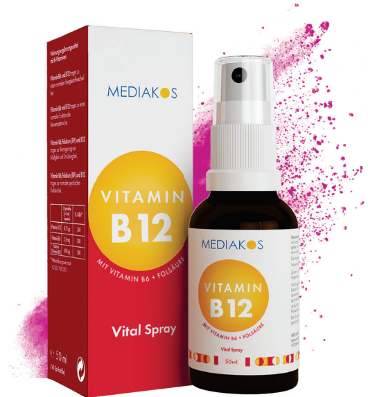
Vitamin B12 + B6 + Folsäure Mediakos Vital Spray Inhalt: 50 ml. PZN: 18317660