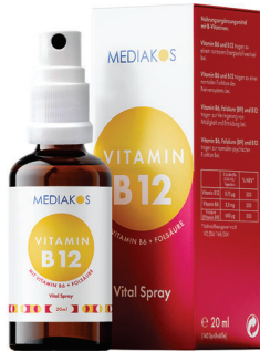
Vitamin B12 + B6 + Folsäure Mediakos Vital Spray 20 ml