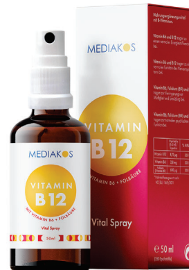
Vitamin B12 + B6 + Folsäure Mediakos Vital Spray 50 ml