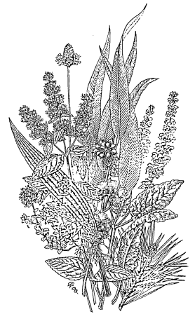
Heilpflanzen im WALA-Garten