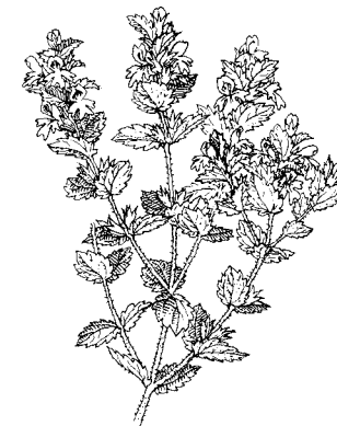
Euphrasia - Augentrost