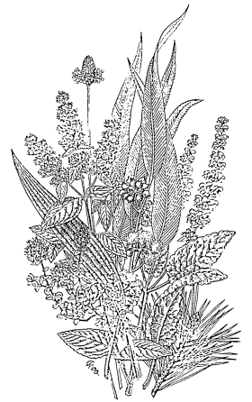
Heilpflanzen im WALA-Garten