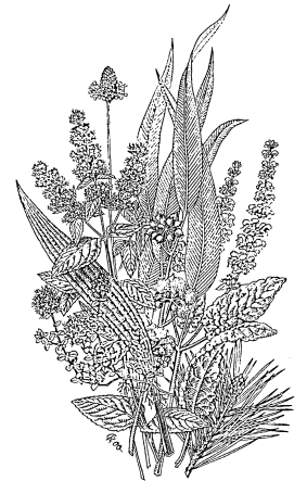
Heilpflanzen im WALA-Garten