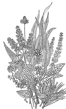
Heilpflanzen im WALA-Garten