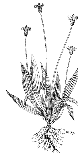
Plantago lanceolata - Spitzwegerich