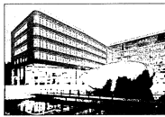
Research Center Beiersdorf, Hamburg