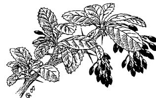
Berberis vulgaris - Berberitze