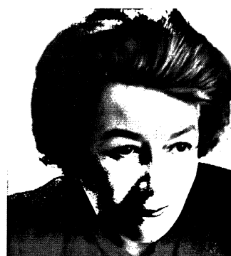
Prof. Dr. Dr. rer. nat. Ana Aslan legte den Grundstein für die ASLAN-Vitaminforschung. Die Zell- und Altersforscherin erhielt für ihre Arbeit neben vielen internationalen Auszeichnungen, z.B. von der UNO und der WHO, auch das deutsche Bundesverdienstkreuz.

ASLAN Life Compound F wurde dagegen speziell auf die Bedürfnisse der modernen Frau abgestimmt.