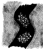
Espumisan® Gold Perlen gegen Blähungen