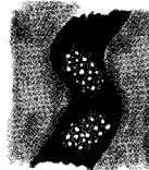
Espumisan® Gold Perlen gegen Blähungen